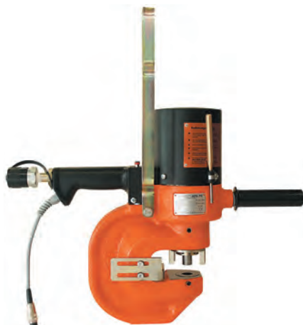
APS 70 23002